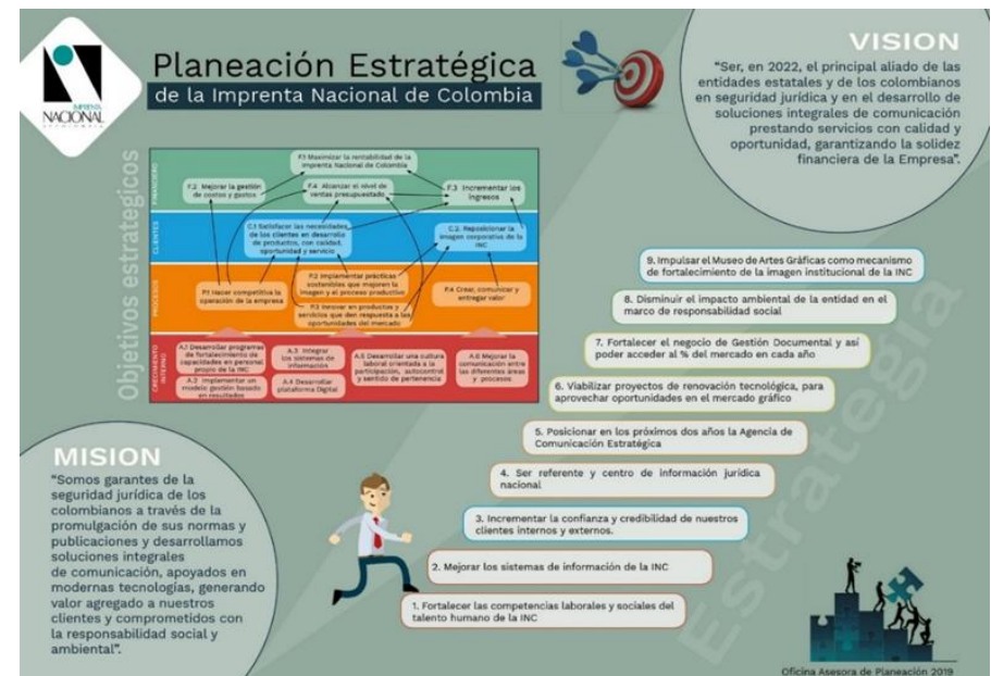
Ilustración 2 Marco Estratégico de la INC 2019 -2022

Fuente: INC – Oficina Asesora de Planeación