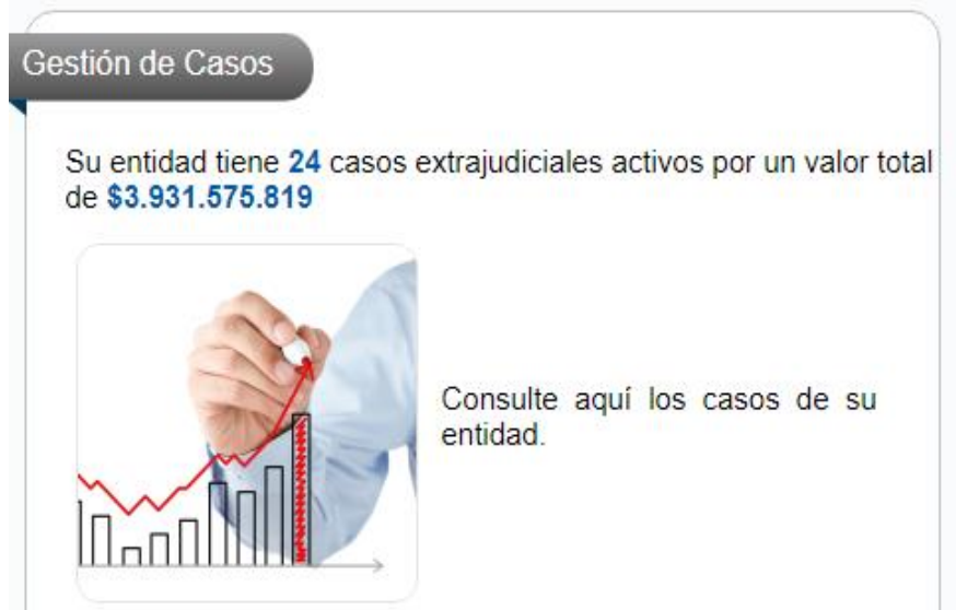
Imagen No. 6

Fuente de la información (Aplicativo eKOGUI)